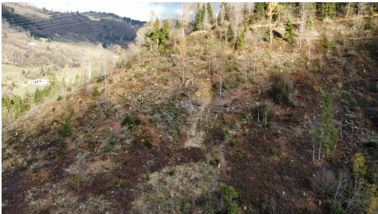
Ripresa aerea del versante