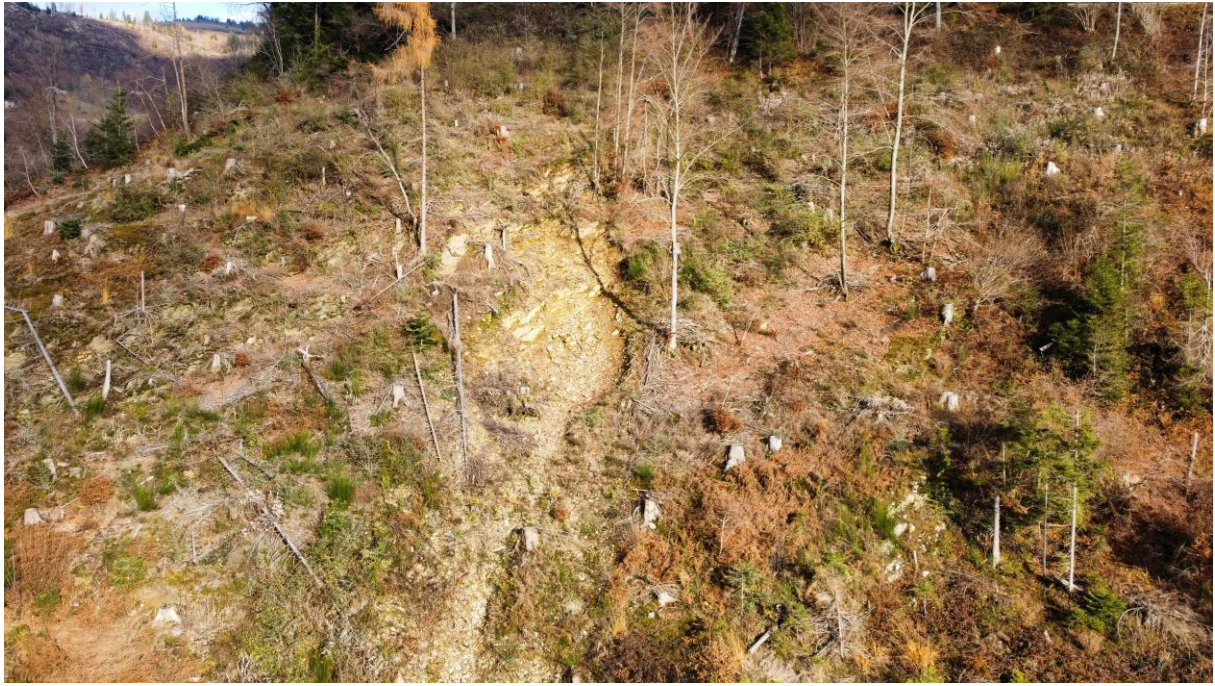
Ripresa aerea del versante