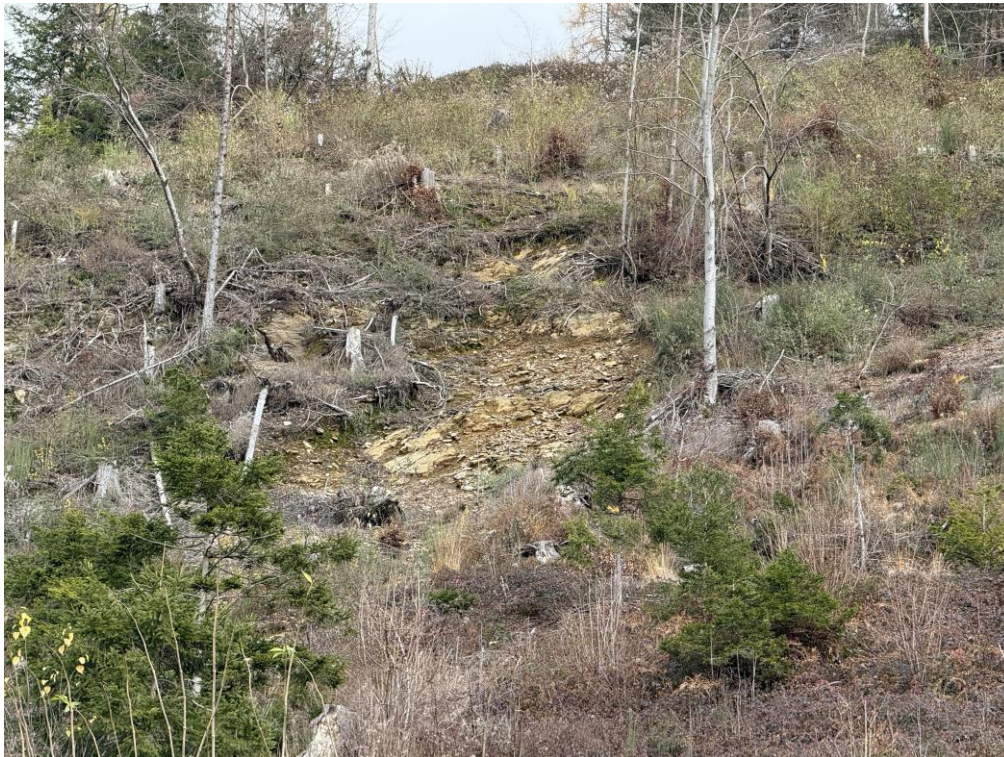
Vista da valle della nicchia di frana