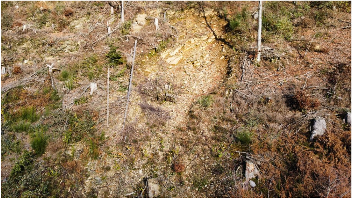
Ripresa aerea della nicchia di frana