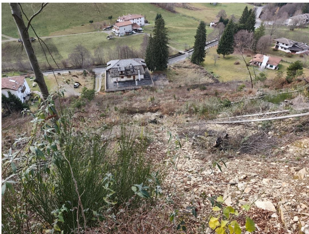
Vista dal versante verso valle