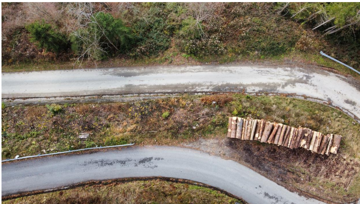
Ripresa aerea della strada a monte del versante