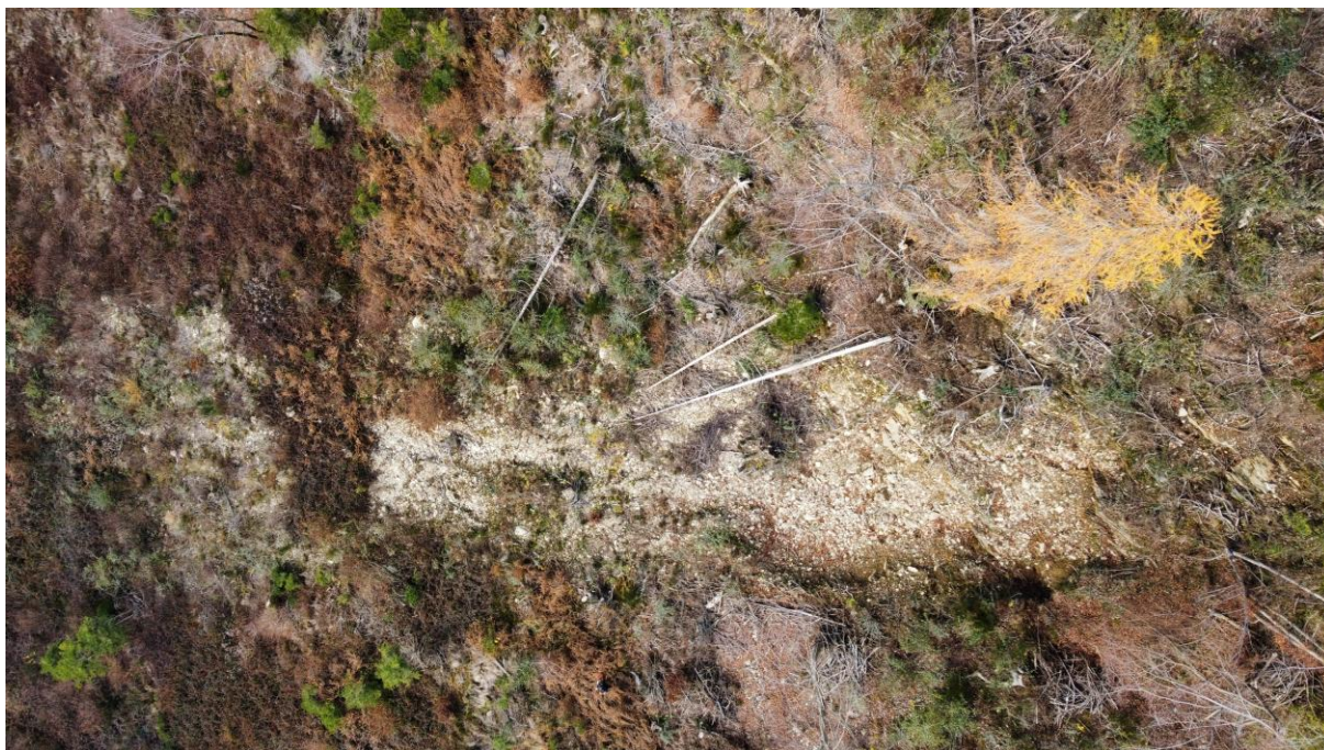
Ripresa aerea della nicchia di frana