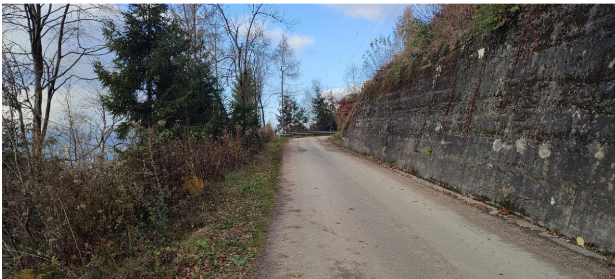
Strada a monte del versante