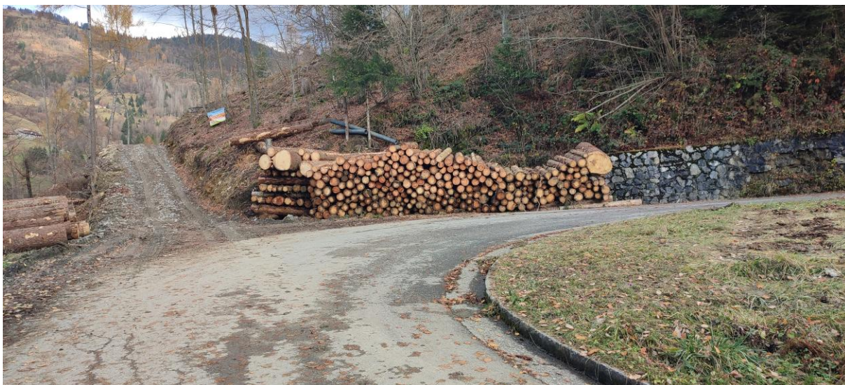
Strada a monte del versante