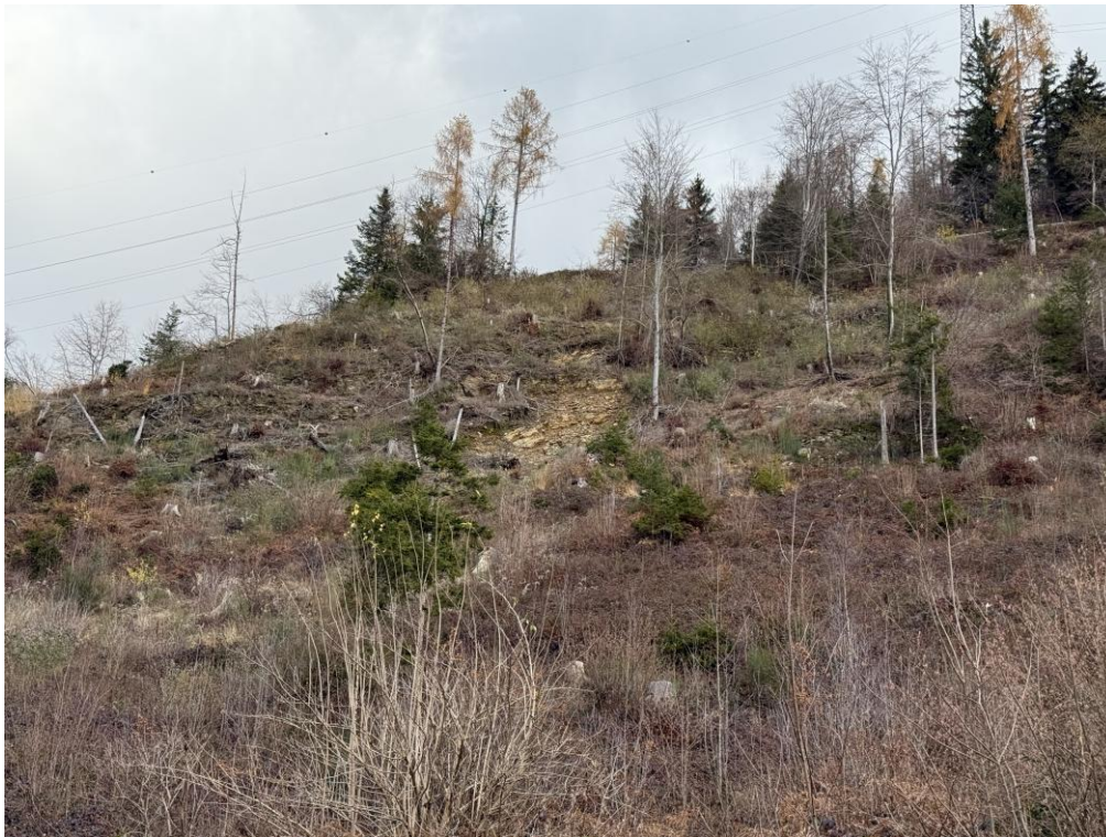
Vista da valle della nicchia di frana