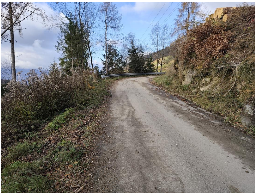
Strada a monte del versante