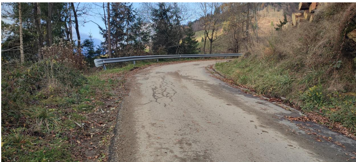
Strada a monte del versante