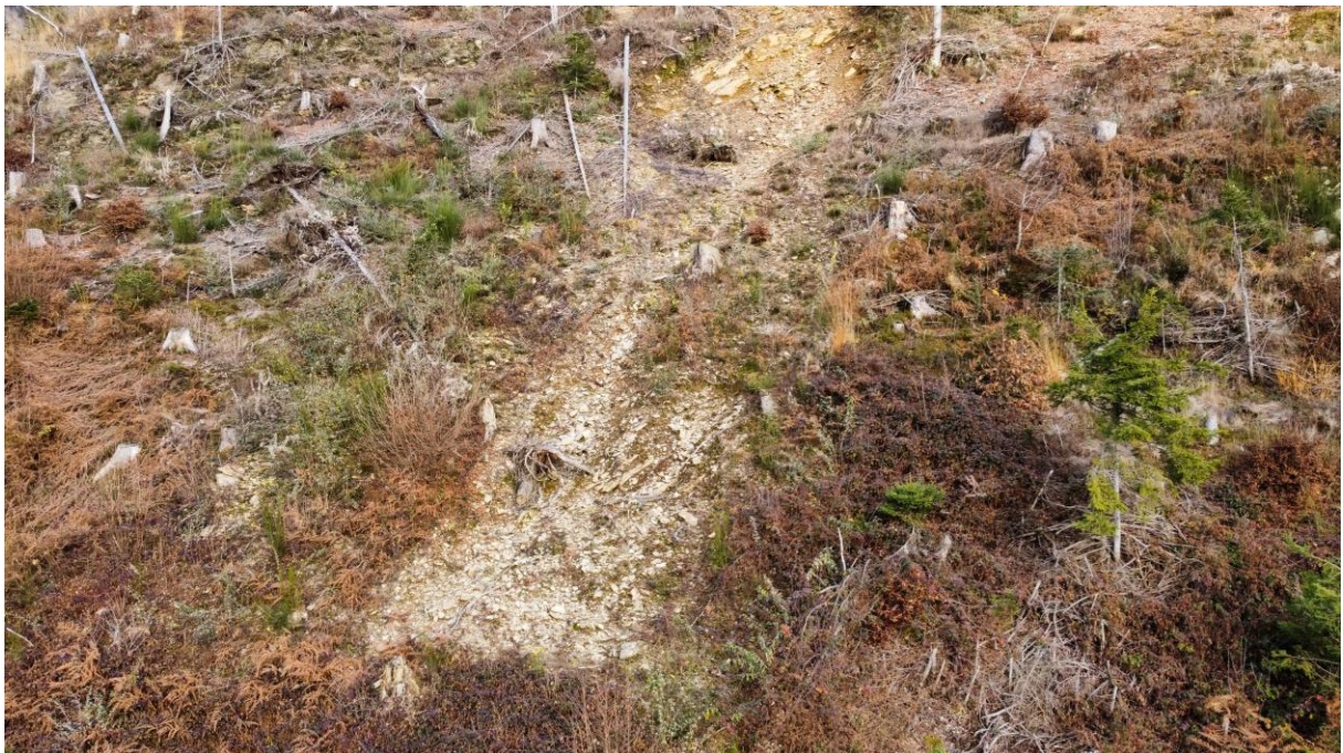
Ripresa aerea della nicchia di frana